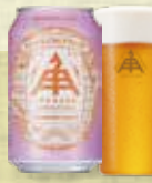
パッションフルーツ ペールエール