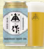
ZAKU Sakekasu Hazy IPA 夏酒