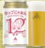
ホップにゃおん 第12艦隊