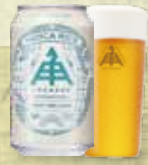
ホッピーライスラガー

上記のほか、特別ブースのビールを合わせ、20種類以上のビールをご提供いたします。 また、少しずつ色んなビールを愉しまいたい方に、4種飲み比べセットもご用意いたします。