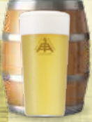
よりみちのラガー