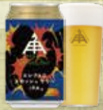
エレクトロ スカッシュサワー IPA