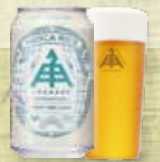
ホッピーライスラガー

上記のほか、特別ブースのビールを合わせ、20種類以上のビールをご提供いたします。