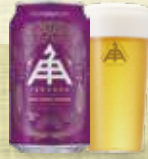
WEST COAST PILSNER