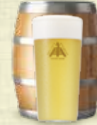
Lush Hop IPA