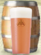
Sour IPA ストロベリー&ラズベリー