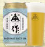
ZAKU Sakekasu Hazy IPA 夏酒