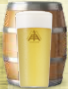
よりみちのラガー