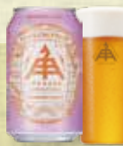
パッションフルーツ ペールエール