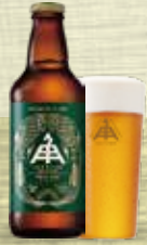
Classic PALE ALE