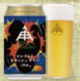
エレクトロ スカッシュサワー IPA