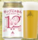
ホップにゃおん 第12艦隊