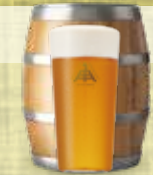
脳がとろける Ultraヘヴン3×IPA