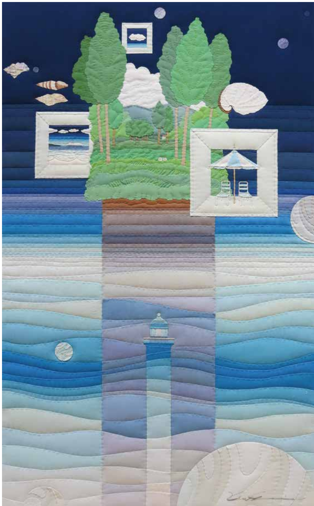
Blue Planet M50号