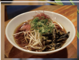
横丁そば小西湖 朔日そば 1,200円