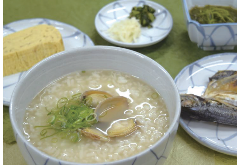
海老丸 あさり雑炊 900円