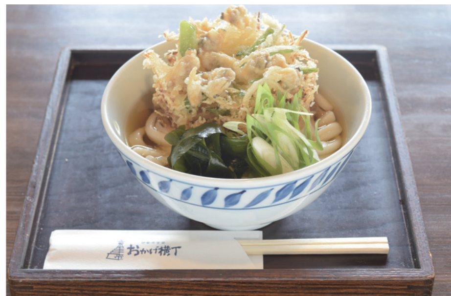
ふくすけ あさりと絹さやのかき揚げうどん 700円