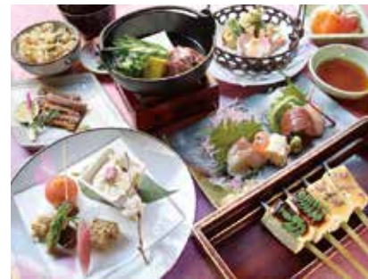
とうふやの料理イメージです。

TEL 0596-25-2848 伊勢市宇治浦田1丁目11-5 TEL 0596-28-1028 伊勢市宇治浦田1丁目4-1 TEL 0596-27-0229 伊勢市宇治中之切町20