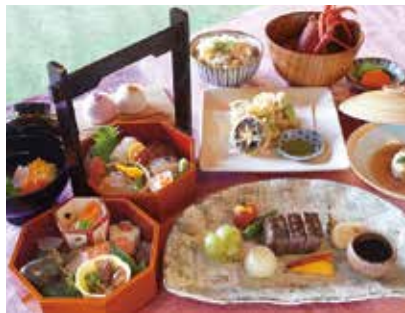
野あそび棚の料理イメージです。