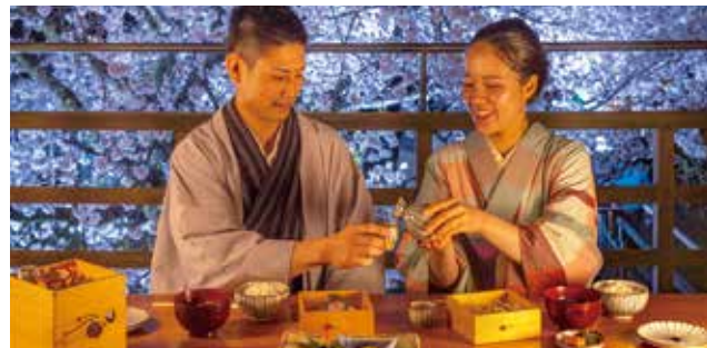
写真は野あそび棚です。