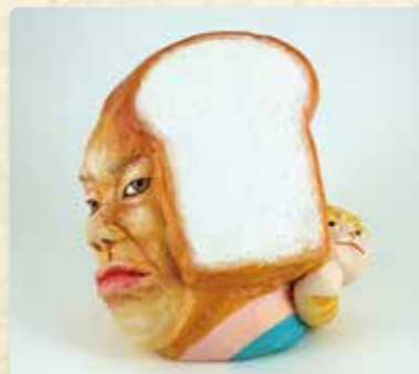
立体造形・画 もりわじん 在廊日：9/17