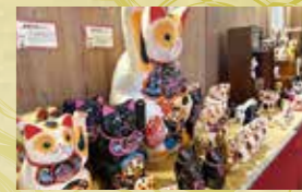
※写真は昨年の様子です。

■場所：五十鈴茶屋 本店向かい 各地で伝統的に作られている郷土玩具の招き猫を集めました。 現在も受け継がれているものから、入手が困難なものまで来る福招き猫まつり限定で販売をする招き猫もご紹介します。