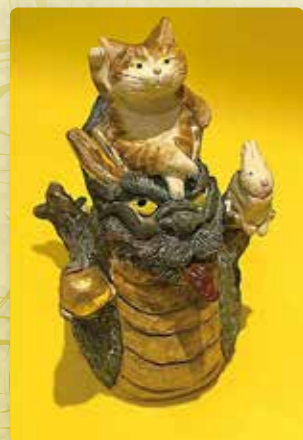
陶芸ほか 水谷満 在廊日(赤福 本店別店舗) 9/16~18、22~29