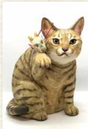
陶芸・絵画 小澤康彦 在廊日：9/16、17