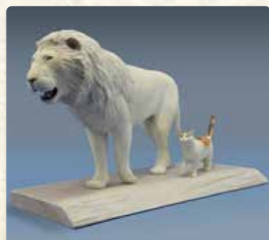
立体造形 細山田匡宏 在廊日：9/16、17