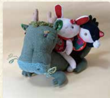
墨絵、ぬいぐるみ 有田ひろみ・ちゃぼ 在廊日(赤福 本店別店舗) 9/16~18