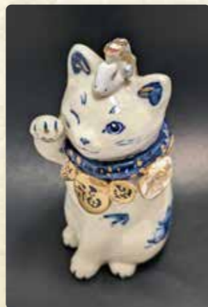
立体造形 佐山泰弘