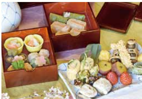
海老丸 手提げ重 3,000円