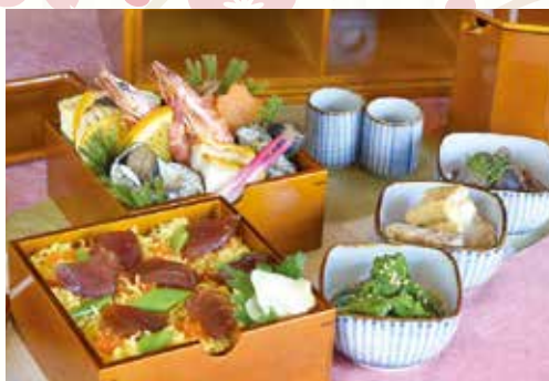
すし久 手提げ重 3,000円