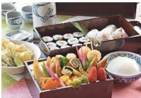
とうふや 手提げ重 3,000円