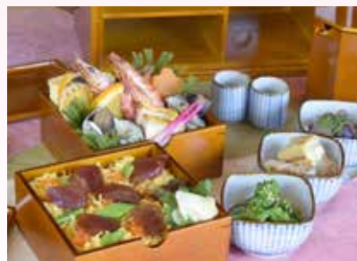
すし久手揚げ重 3,000円(2人前)

【花見手揚げ重の予約限定販売について】 お渡し日時/3月30日(水)～4月5日(火) 11:00～14:00 ※1日5食限定 お渡し場所/五十鈴川河川敷 花見屋台 詳しくは、おかげ横丁ホームページをご覧ください。