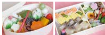
桜むすび 800円 花見寿し 1,200円

【花見弁当の予約限定販売について】 お渡し日時/4月2日(土)、3日(日) 11:00～13:00 お渡し場所/野あそび棚(五十鈴川野遊びどころ内) 詳しくは、おかげ横丁ホームページをご覧ください。