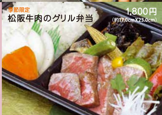
季節限定 松阪牛肉のグリル弁当 1,800円 (約17.0cm X 23.0cm)