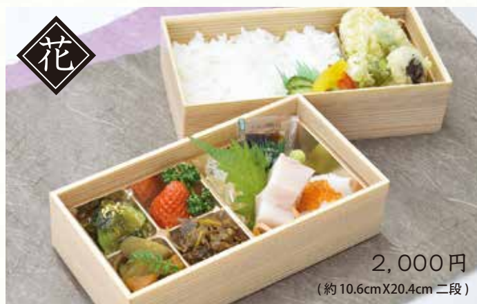
2,000円 (約10.6cmX20.4cm 二段)

かまど炊きの土鍋ごはん 野あそび相 三重県伊勢市宇治浦田一丁目11-5 電話番号0596-25-2848