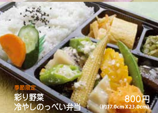
季節限定 彩り野菜冷やしのっぺい弁当 800円 (約17.0cm X 23.0cm)