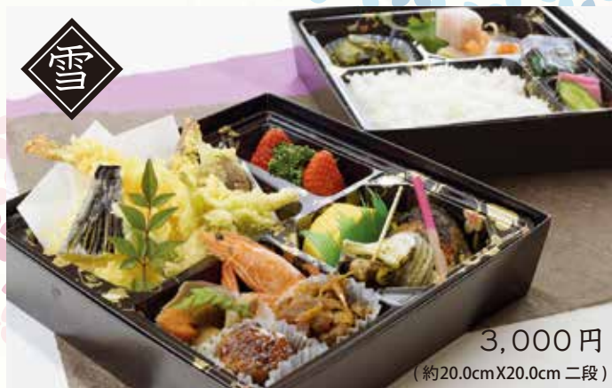
3,000円 (約20.0cmX20.0cm 二段)