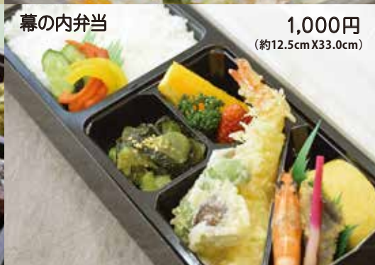
幕の内弁当 1,000円 (約12.5cm X 33.0cm)