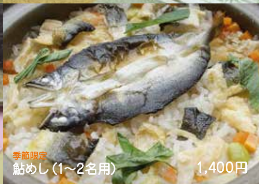
季節限定 鮎めし(1~2名用) 1,400円