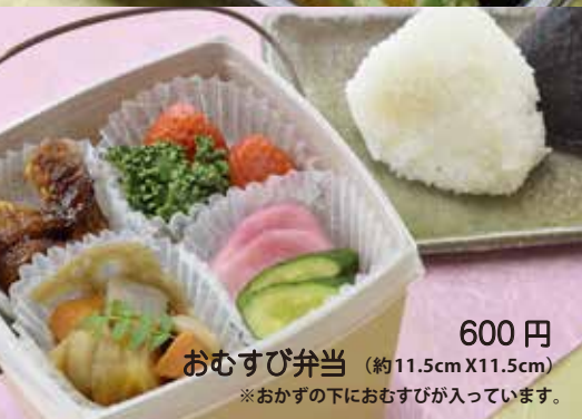
600円 おむすび弁当 (約11.5cm X 11.5cm) ※おかずの下におむすびが入っています。