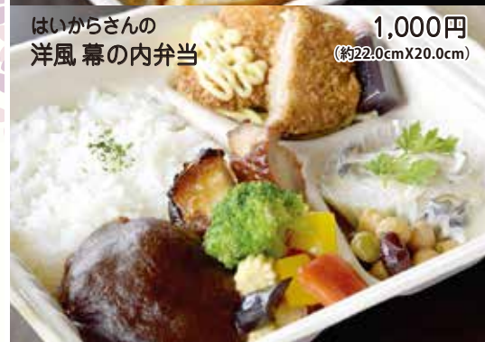
はいからさんの 洋風 幕の内弁当 1,000円 (約22.0cm X 20.0cm)