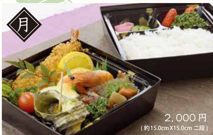
2,000円 (約15.0cmX15.0cm 二段)