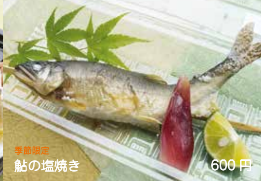
季節限定 鮎の塩焼き 600円