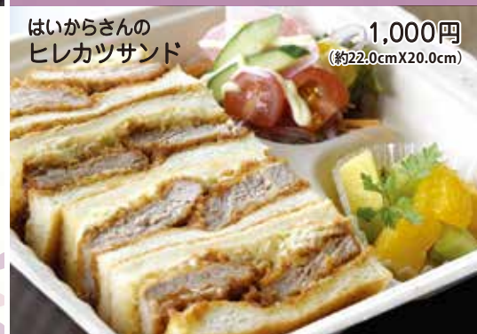
はいからさんの ヒレカツサンド 1,000円 (約22.0cm X 20.0cm)