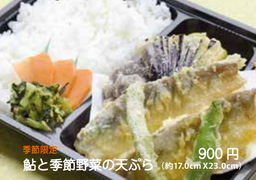
季節限定 鮎と季節野菜の天ぷら 900円 (約17.0cm X 23.0cm)