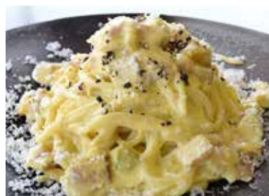
かぼちやのカルボナーラ