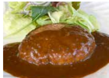
はいからさんハンバーグ (ライス、スープ付) ¥1,450