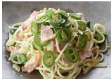
生唐辛子 青のペペロンチーノ