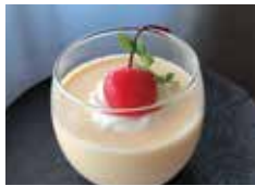
はいからさんプリン