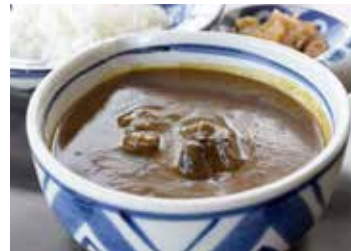
はいからさんカレー ¥960