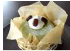
伊勢茶のババロア