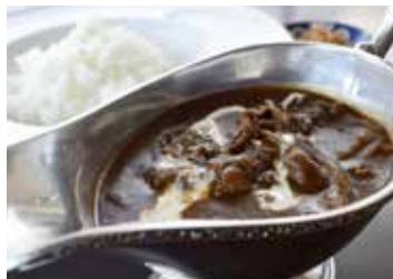
はいからさんハヤシライス ¥980