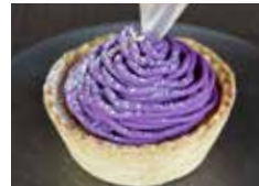
紫芋のイモンブラン