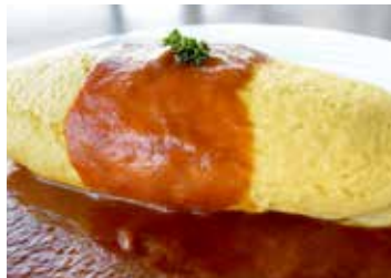
はいからさんオムライス ¥900