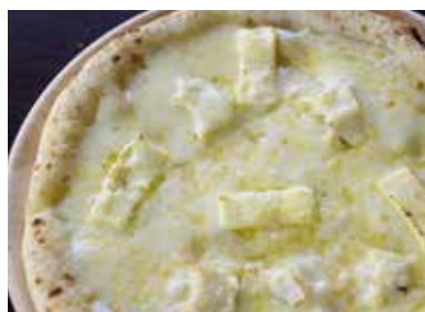
地酒「作」の酒粕クアトロフォルマッジ ¥1,500