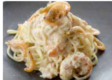
海老のクリームパスタ

松阪牛ミートのおいしさを、半熟たまごとチーズが一体感のある味わいを作りながら引き立てています。