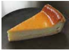
鳥羽国際の チーズケーキ