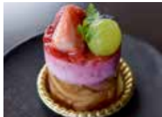
フランボワーズショコラ