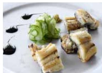
伊勢うなぎ白焼き ¥1,200