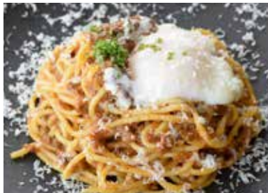
松阪牛ミートパスタ