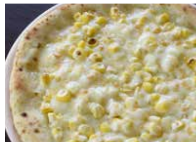
コーンクリームマヨ ¥1,000