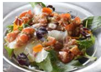
伊勢志摩のカルパッチョ ¥850