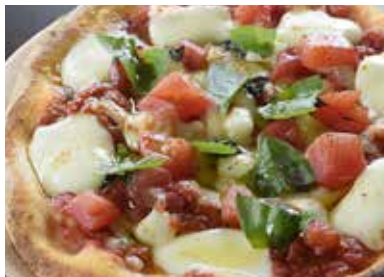
フレッシュトマトのマルゲリータ ¥1,200