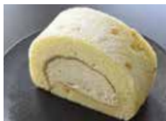
真珠塩の キャラメルロールケーキ