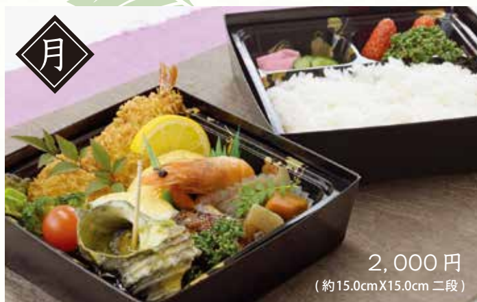
2,000円 (約15.0cmX15.0cm 二段)