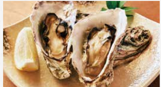
蒸しかき 2ヶ ¥1,200